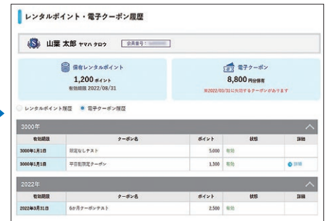
レンタルポイント・電子クーポン履歴ページ