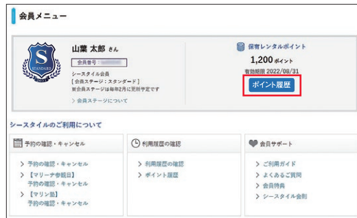
会員メニューページ